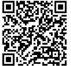
説明とチューブ性能